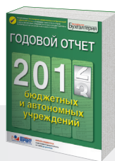
Годовой отчет бюджетных и автономных учреждений