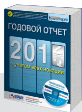
Годовой отчет коммерческих организаций