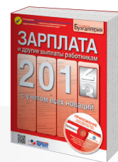
Зарплата и другие выплаты работникам

Для читателей книг создан специальный сайт go.garant.ru